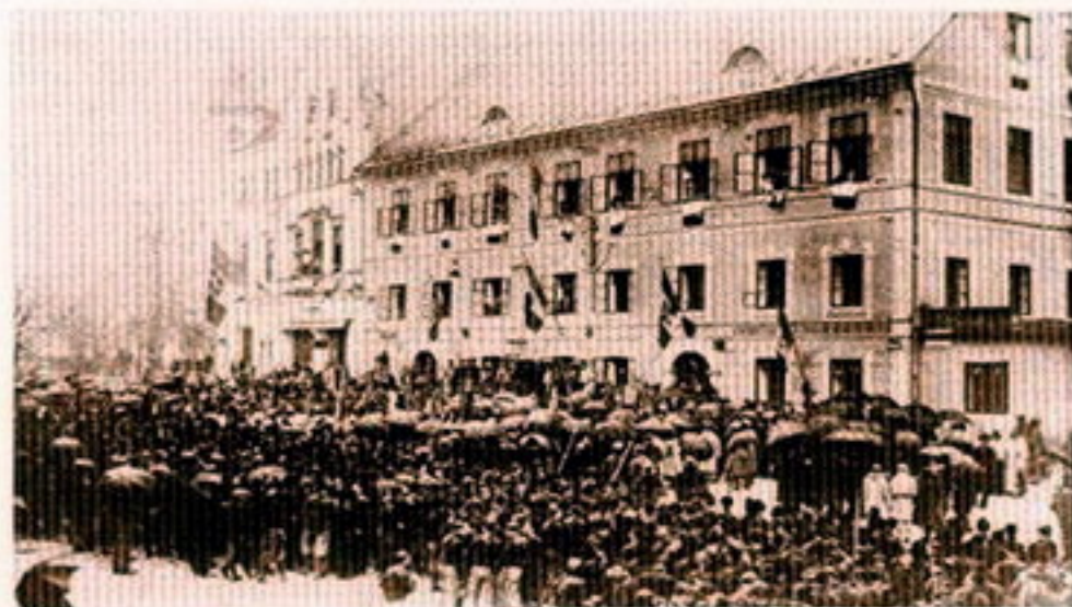
Fašistično zborovanje v Idriji. Sedanji trg maršala Tita se je imenoval „Piazza Vittorio Emanuele III.“ V prizidku stavbe št. 3 je bil sedež občinskega vodstva fašistične stranke.