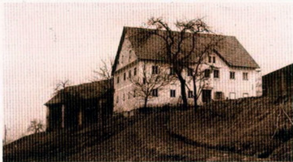
Močnikova domačija v Srednji Kanomlji