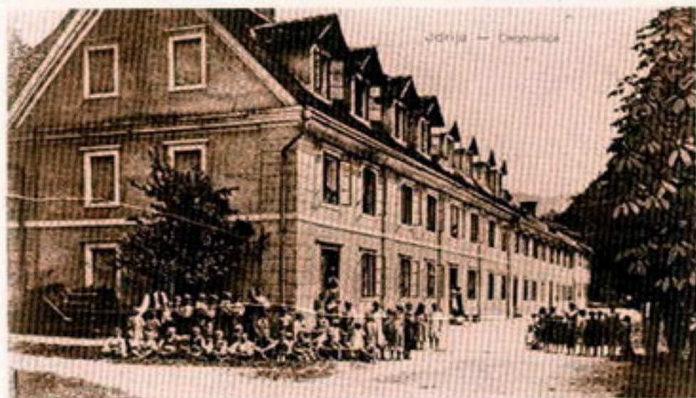
Stara rudarska hiša v Cegovnici, zgrajena proti koncu 19. stoletja. Iz Cegovnice je 7. januarja 1943 odšla v partizane prva večja skupina Idriččanov.