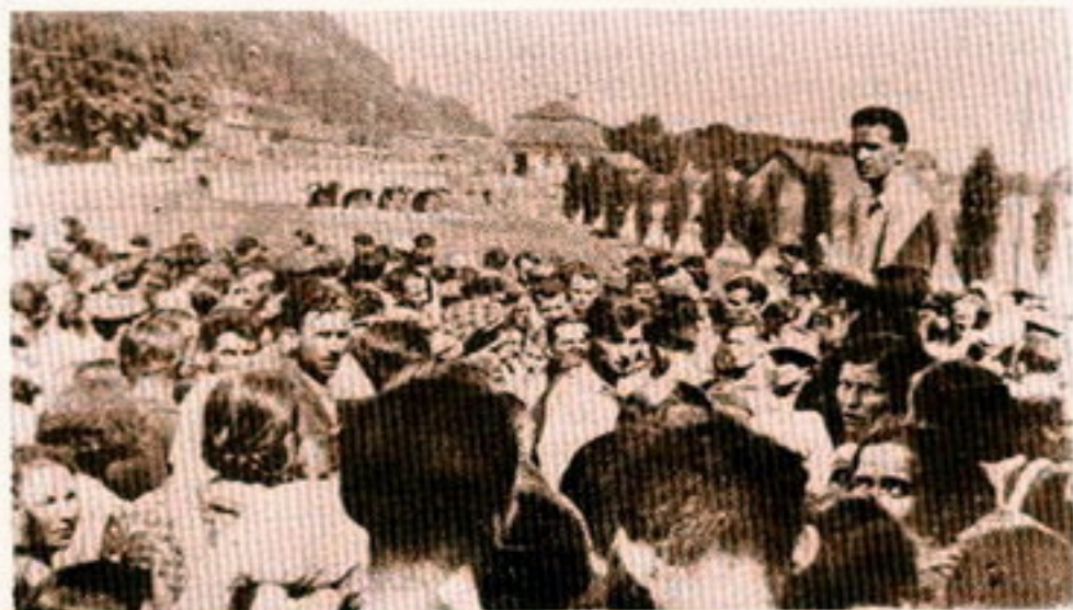
Ivan Tominec govori stavkajočim delavcem v Kranju leta 1936