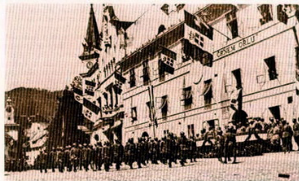
Vojaška parada po prihodu italijanske vojske v Idrijo leta 1918