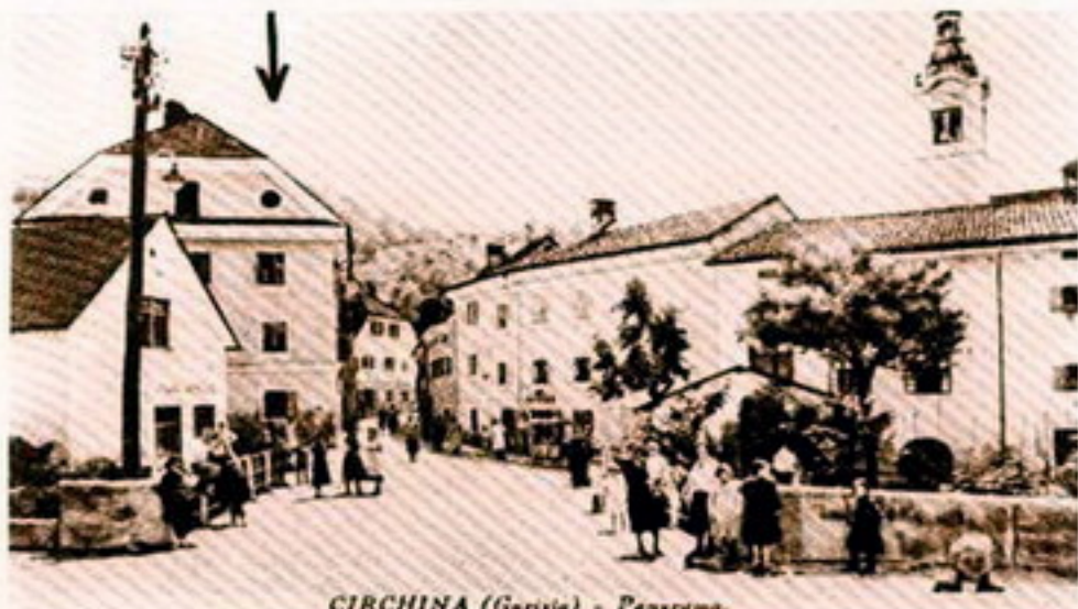
CIRCHINA (Gorizia) - Panoramo.

Razmere, ki so vladale v Julijski krajini v obdobju med prvo in drugo svetovno vojno, so se kazale tudi na njenem severo-vzhodnem delu, na Baškem, Cerkljanskem in Idrijskem. Kaže pa ta predel tudi nekaj posebnosti. Iz agrarnega področja je po svoji zapleteni problematiki izstopala rudarska Idrija.