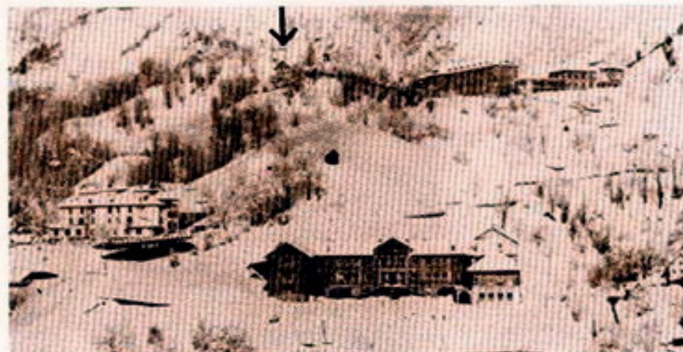
Kobalova domačija (zgoraj levo), „Plazzina“ – stanovanjska stavba za italijanske oficirje (levo). Sedanji dijaški dom – stavba je bila zgrajena za samostan (v sredini), Vojašnica – sedaj psihiatrična bolnišnica (zgoraj desno). Kobalova domačija je bila javka za prostovoljce iz Idrije, ki so odhajali v NOV.