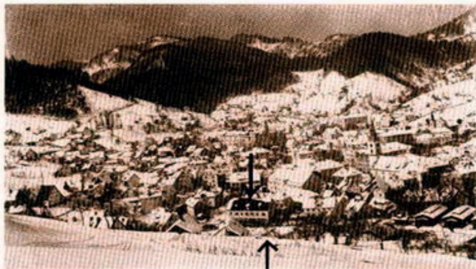
Zgoraj: Stavba, v kateri je bil sedež „Nucleo mobile“