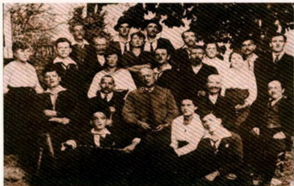
Člani komunistične sekcije v Cerknem leta 1920

Val socialističnih idej je v letih 1920 in 1921 prodrl tudi na Cerkljansko, ki pred prvo svetovno vojno organiziranega delavskega gibanja ni poznalo. Komunistično glasilo „Delo“ je dne 27. 2. 1920 prineslo novico iz Idrije, da je bila prva številka v hipu razprodana, ne le v Idriji, tudi v Sp. Idriji, Otaležu, Lazcu, Plužnjah in Cerknem. „Lep dokaz“, pravi dopisnik, „kako željno je ljudstvo pričakovalo slovenskega socialističnega lista“. Marca istega leta so iz Cerkna poročali, da je v komunistični stranki osemdeset članov, maja pa so navedli šestdeset članov (13).