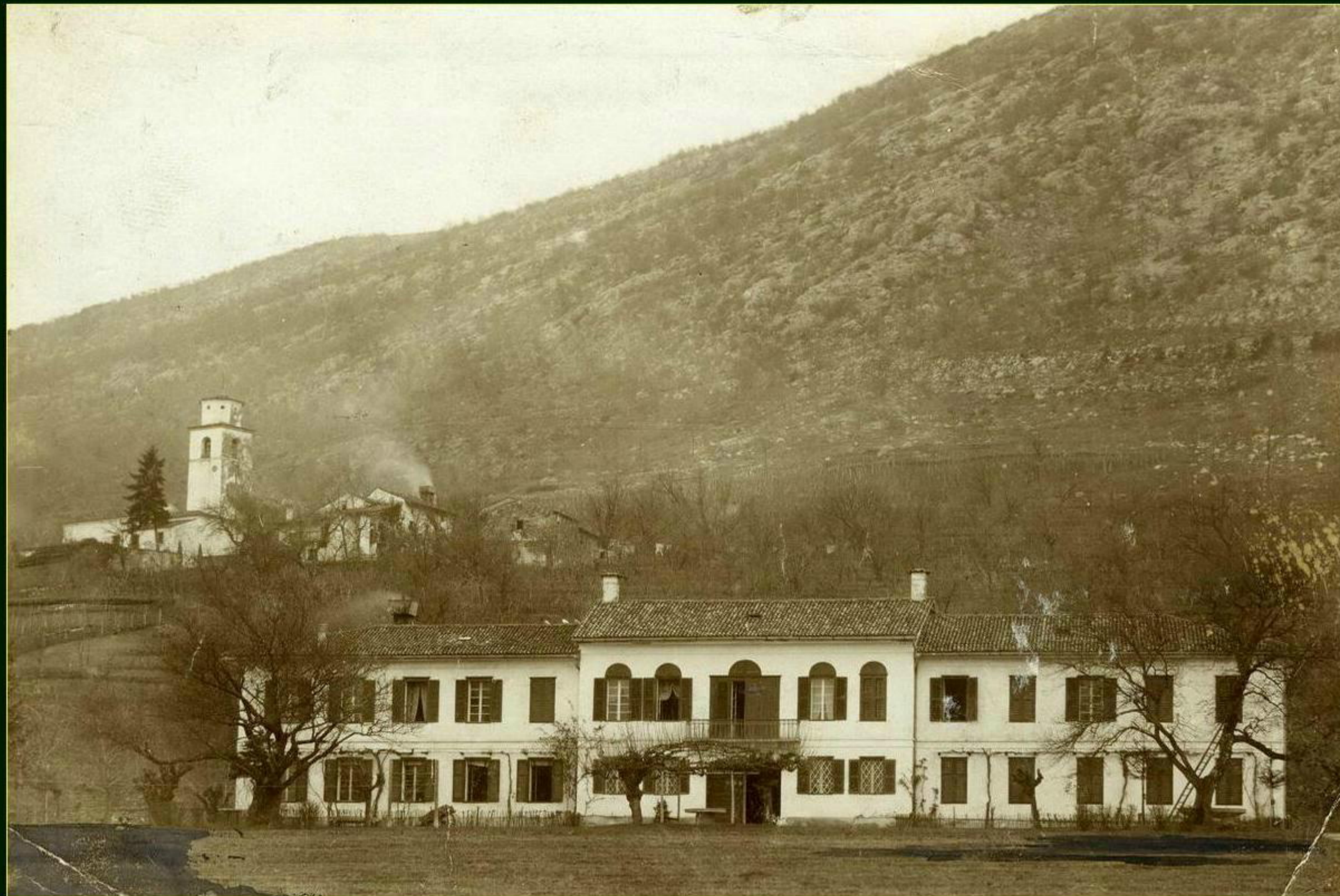
Atelje Franc Kunc, Ljubljana - Št. Maver pri Gorici