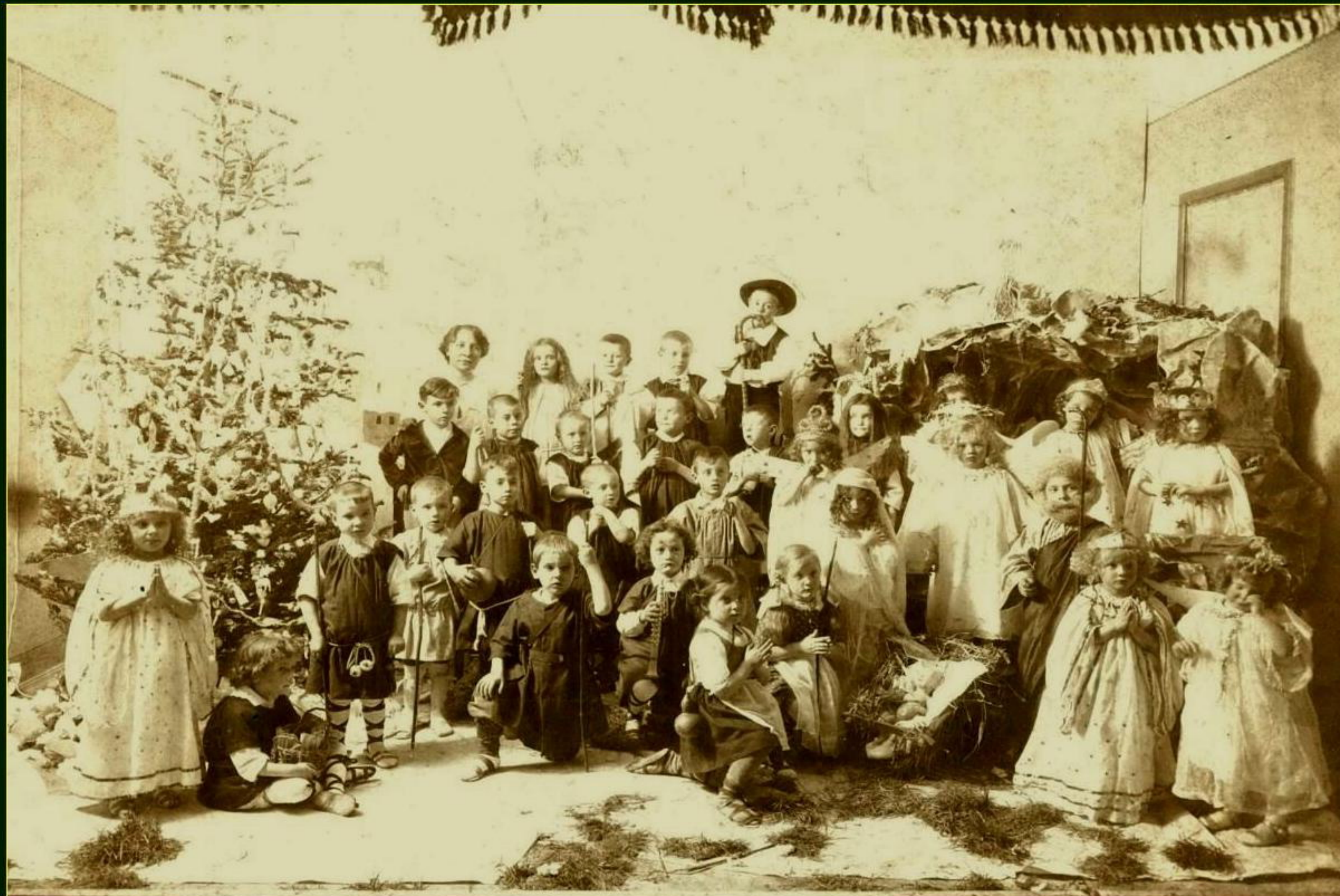
Atelje F. Penco, Trst - Božič