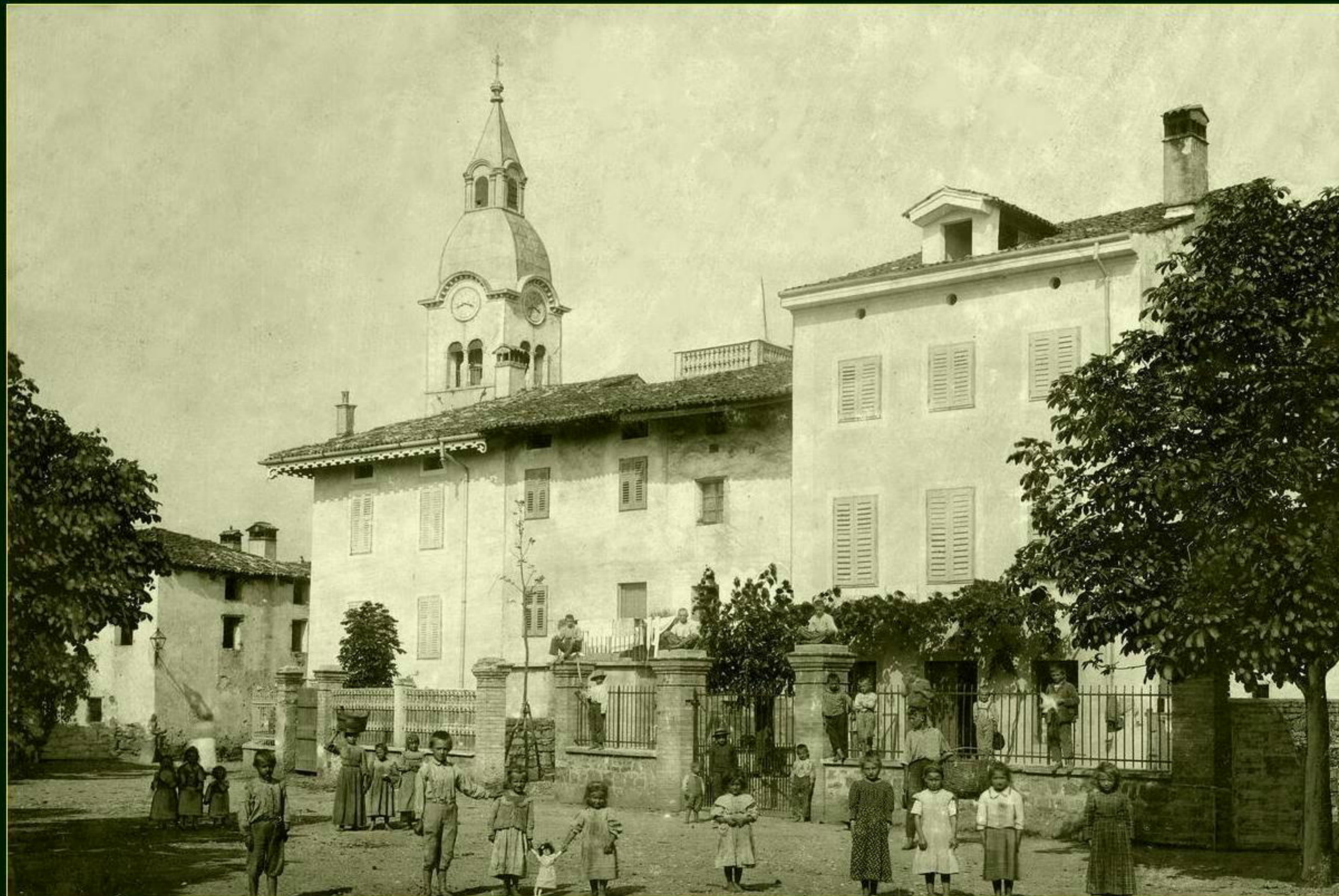
Atelje Franc Kunc, Ljubljana - Renče