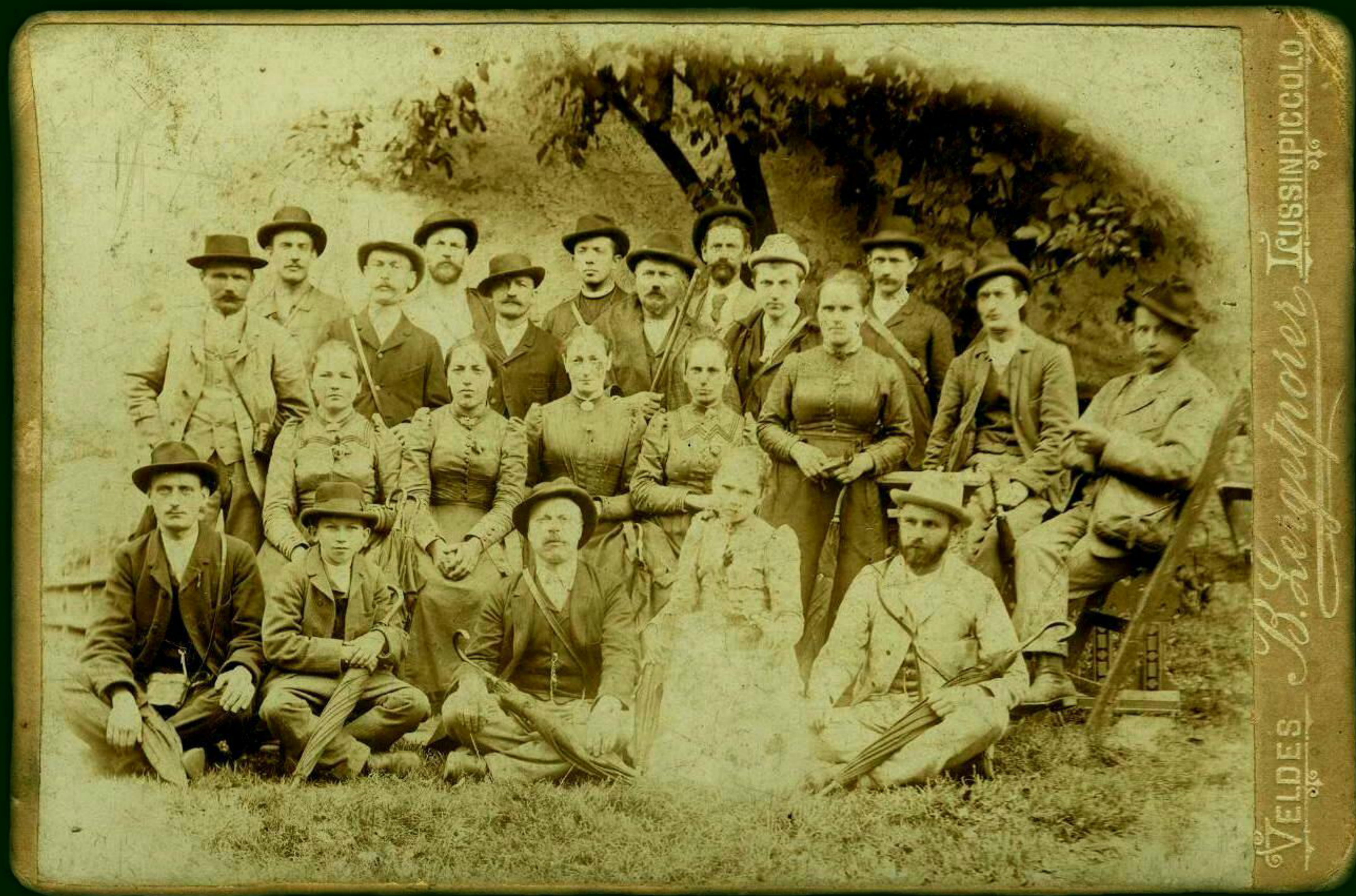
Cerkljanski veljaki na Bledu v začetku prejšnjega stoletja