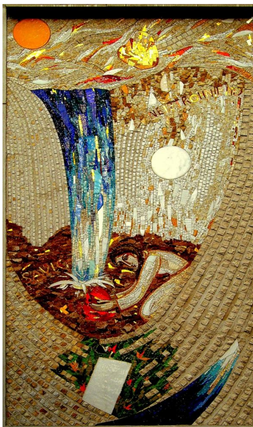
Mozaik p. Mirka I. Rupnika »Neiztrohnjeno srce« na čelni fasadi hiše na Opekarski cesti v Ljubljani.

Danes nam Slovencem vedno bolj primanjkuje ravno srca. Ne toliko v smislu srčne kulture, čeprav nas tudi v tem pogledu vedno močnejše najedata egocentrizem in brezbržnost. Težava je predvsem v vedno večjem pomanjkanju hrepenenja in radosti. Stanje duha v družbi je nadvse skrb zbujajoče, kar se na površinski ravni kaže predvsem v ekonomski in socialni krizi, na globljih ravneh pa v vrednotni zmedi, negotovosti, v vsesplošnem in dramatičnem porastu nezaupanja državljanov v državne in nekatere druge družbene institucije ter v vedno bolj resignirani držki ljudi, ki so enostavno siti vseh tistih političnih, gospodarskih in drugih elit, ki se ukvarjajo pred sem same s sabo ter se ob tem v posmeh ljudstvu pogosto obnašajo še nedostojno, negospodarno ali celo koruptivno. Ljudje bi se zagotovo pogumneje in z večjim razumevanjem soočili z ekonomsko in socialno krizo, če bi to krize ne spremljalo toliko utemeljenih dvomov o sposobnosti, delavnosti, dobronamernosti, poštenosti in družbeni odgovornosti mnogih pomembnih nosilcev oblasti in kapitala.